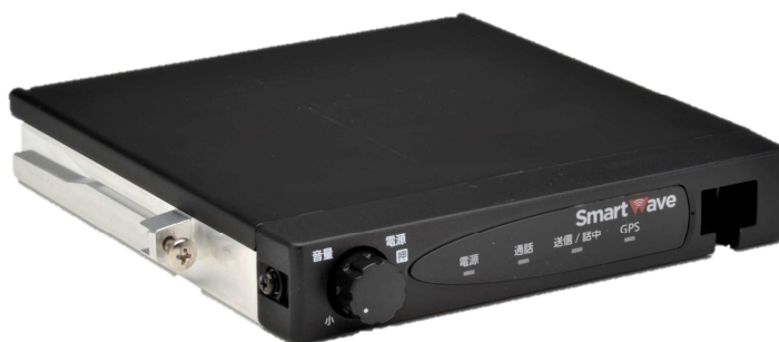
SmartWave 車載機 SV-1000